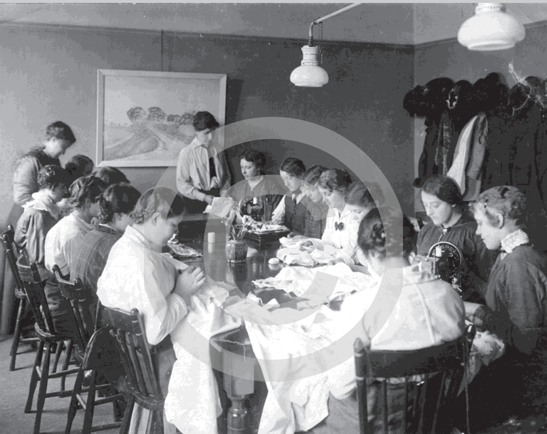
Talentontwikkeling omstreeks 1900